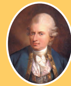
Johann Friedrich Graf von Struensee

1998 geht die Anlage in Privatbesitz. Seitdem ist sie Sitz des Land-Museums Gestüt Traventhal e.V. Regelmäßig finden hier kulturelle Begegnungen und Veranstaltungen statt.