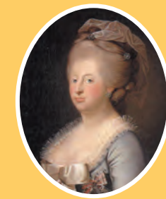
Caroline Mathilde Königin von Dänemark